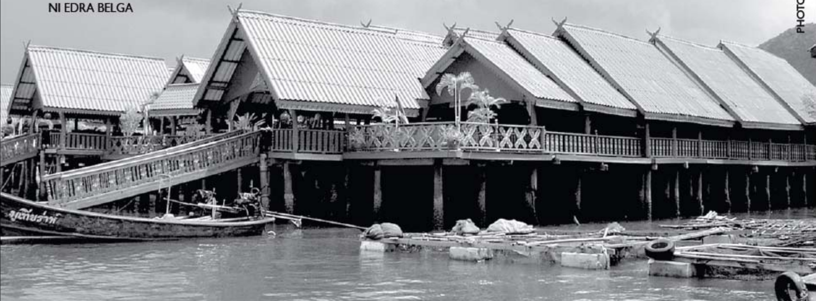
Ang Panyee Island ay isang komunidad na naka-tungkod-bahay sa Phang-nga Bay sa hilaga ng Phuket, Thailand. Isa itong lugar na pinupuntahan ng mga turista, dahil sa kakaiba nitong karakter.