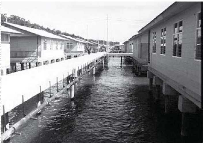
Ang modernong bahagi ng Kampung Ayer sa Brunei ay merong “vacuum network system” na humihigop ng dumi mula sa mga tahanan sa pamamagitan ng mga konektadong tubo patungo sa isang planta (sewerage treatment plant) kung saan sinasala ang mga maduming tubig.

HTTP://WWW.SULTANATE.COM/ISITBRUNIBKAMPUNGAYER