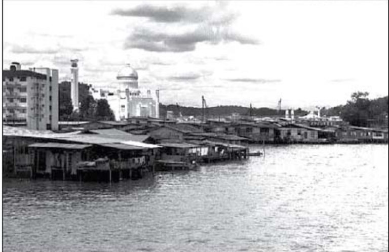
Ang Kampung Ayer sa Brunei ay tinuturing na isa sa mga pinakamatandang panirahanan na puro tungkod-bahay. Ito ay makikita sa ibabaw ng Ilog Brunei. Araw-araw ang mga residente dito ay hinahatid ng mga de-motor na bangka o "water taxis" sa maliliit na pantalan sa lungsod.

Sa Pilipinas, isa pa ring malaking usapin ang pabahay para sa mga nangangailangan. Bagama't patuloy ang pagbibigay ng pamahalaan at ng iba pang organisasyon ng serbisyong pabahay, tila patuloy pa rin ang paglaki ng bilang ng populasyon na walang disenteng pabahay. Ang solusyon sa problemang ito ay iba't iba. Sa ilang piling sitwasyon, maaaring isang alternatibong teknikal na solusyon ang maging kasagutan.